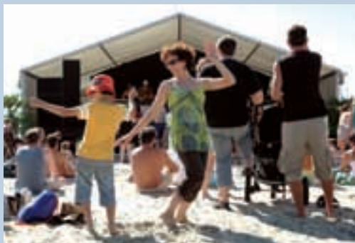
Onze foto bewijst alvast dat het er op Dunia 2006 vrolijk aan toe ging!