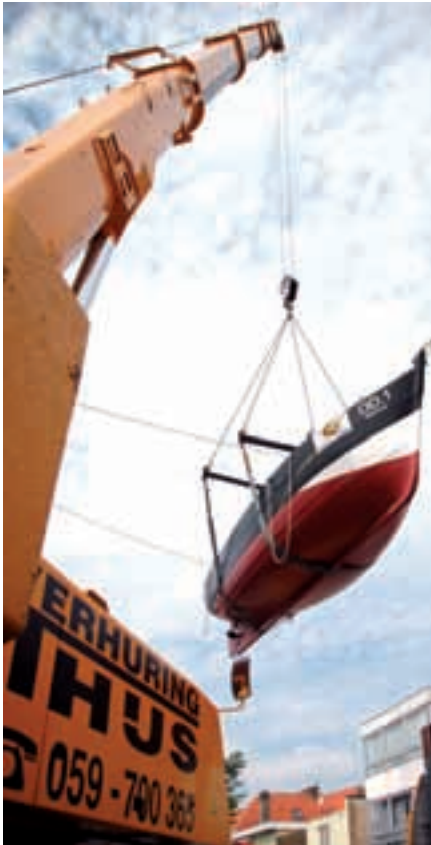
1. Zaterdag 24 juni: hoog en droog bengelt de OD.1. Martha tussen hemel en aarde...

Het nieuwe Nationaal Visserijmuseum in opbouw is een belangrijke stap verder in zijn groei. Op zaterdag 24 juni werd het kustvissersvaartuig OD.1 Martha, onder grote belangstelling en op succesvolle, spectaculaire wijze in het nieuwe museum geplaatst. De bouw van het nieuwe visserijmuseum heet officieel als volgt: "Het zeil wordt in de top gezet – Cultuurtoeristisch project ter revalorisatie van de maritieme erfgoedsite Nationaal Visserijmuseum Oostduinkerke".