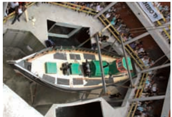
3. en weinig ogenblikken later ligt het schip veilig en wel aangemeerd aan zijn nieuwe kade...