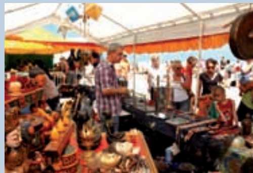
Op het wereldfeest Dunia 2006 waren vele prachtige ambtelijke producten uit de Derde Wereld te koop.