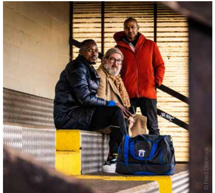
>> Een ontroerende voorstelling op 19 oktober.

Bekijk deze voorstelling met een theatericoon in de hoofdrol op zaterdag 19 oktober om 20 uur. Een ticket krijg je voor 20 euro. Jonger dan 26? Dan betaal je 17 euro. Meer info en reservatie op www.casinokoksijde.be of 058 59 29 99.