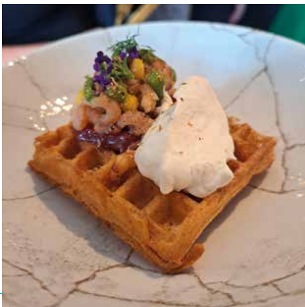
>> Het winnende gerecht van The Eatery.

We geven dus aan dat het hier veiliger is geworden. West-Vlaanderen komt er dan nog eens als meest fietsvriendelijke provincie uit. En in slechts één andere gemeente vinden de mensen de route naar school veiliger dan in Koksijde. Grote onderscheiding dus.