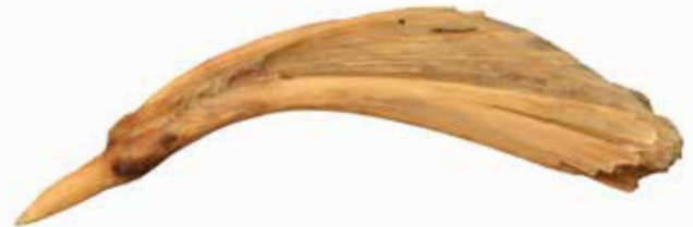
>> Eén van de gevonden botten.

De rekening van de Duinenabdij van 1568-1569 geeft aankopen van pladijs aan gedurende heel het jaar, met de grootste aankopen in de vasten en in de zomer. Alleen rog werd heel het jaar door aangekocht, bot alleen in de zomer.