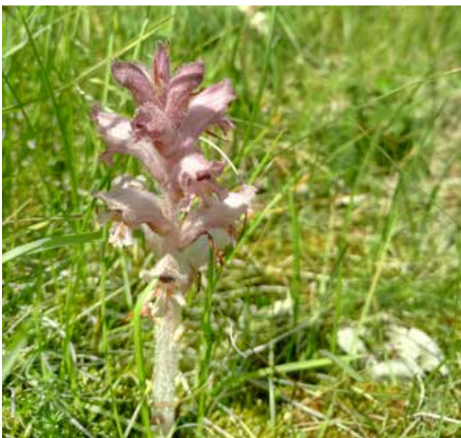
>> De walstrobremraap is een 10-60 cm hoge plant en een parasiet die voornamelijk voorkomt op geel walstro en glad walstro.

Duinstruwelen: hier vinden we struiken zoals duindoorn, meidoorn, sleedoorn, vlier en diverse soorten rozen. De struiken bieden beschutting aan verschillende diersoorten en de bessen van duindoorn zijn tot diep in het najaar een belangrijke voedselbron voor vogels. Onder meer Amerikaanse vogelkers en cotoneaster zijn hier grote boosdoeners.