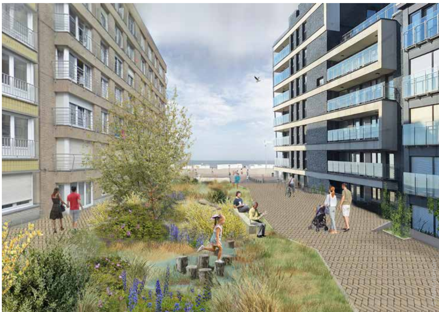
>> Voorbeeld Joststraat