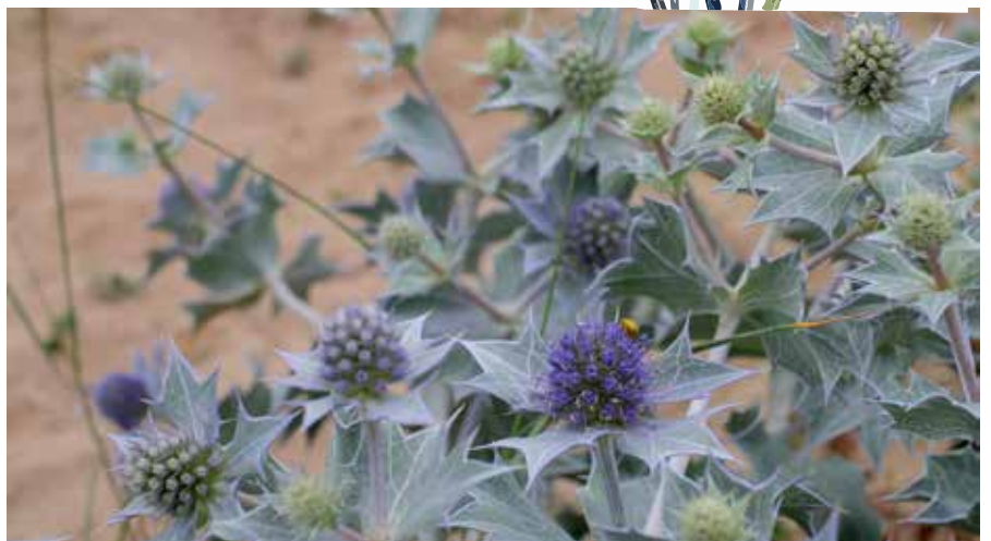
>> De blauwe zeedistel bloeit van juni tot augustus met blauwachtige of witte bloemen, die in hoofdjes zitten.